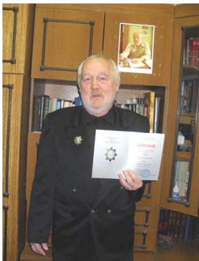
Главный редактор демонстрирует «как знамя журнала» знаки ордена Г. Р. Державина

Орденом Г. Р. Державина награждены «Приокские зори» за верное служение русской литературе и дальнейшее развитие традиций русской литературной журналистики.