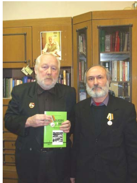
Свою Ломоносовскую медаль главный редактор передает журналу «Приокских зорь» и вручает ее зав. редакцией на хранение