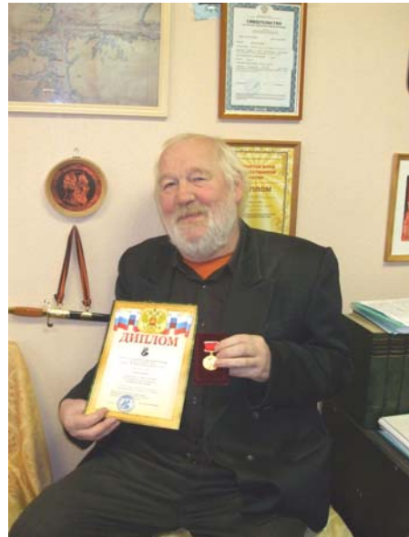
...Главный редактор также удостоен Некрасовской премии за личный творческий вклад в современную русскую литературу