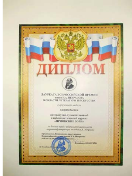
Медаль и диплом Некрасовской премии, которой удостоен журнал «Приокские зори»