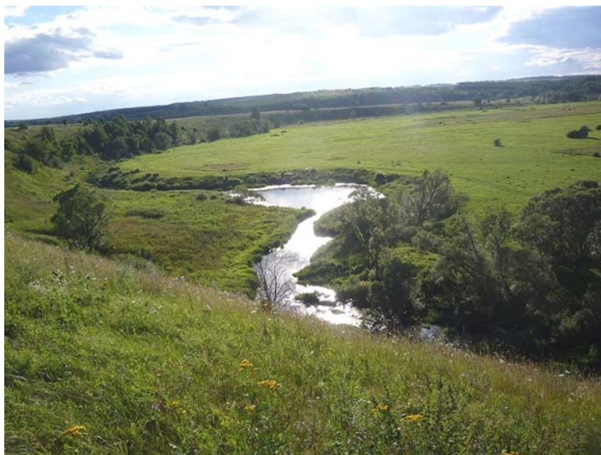
Бежин луг