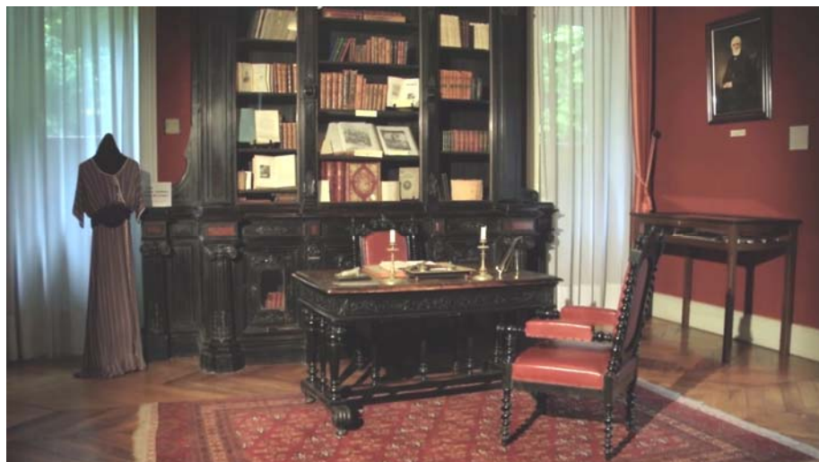
Рабочий кабинет И. С. Тургенева в Буживале (кадр из фильма «Le Musée Tourguéniév à Bougival — Музей Тургенева в Буживале»)