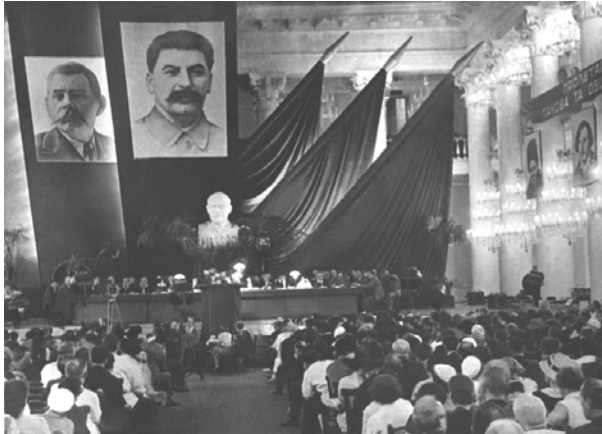
В зале заседаний Первого съезда советских писателей