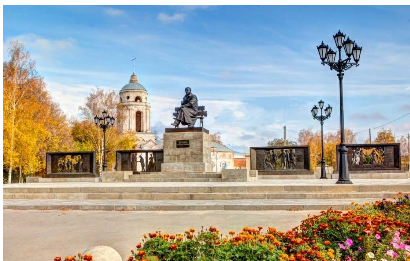
Наровчат. Общий вид архитектурно-скульптурного ансамбля А. И. Куприну. (2015 г.) Авторы А. Хачатурян, Д. Димаков