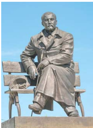
А. И. Куприн.