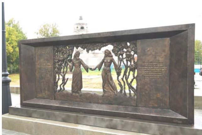
«Суламифь». Фрагмент Ансамбля