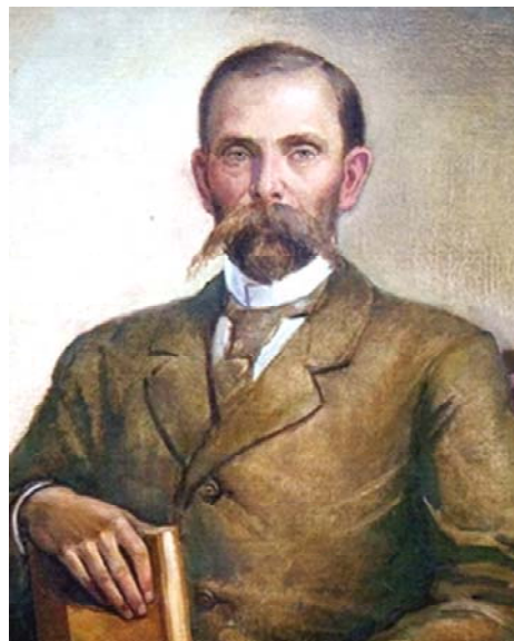
Франциск Казимирович Богусевич