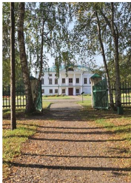
Аллея Верхнего парка в усадьбе Карабиха