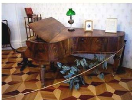
Карабиха. В Большом доме. Интерьеры конца XVIII — начала XIX вв.