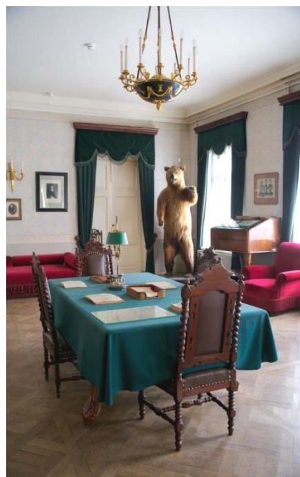
Мемориальный Музей-квартира Н. А. Некрасова в С.-Петербурге